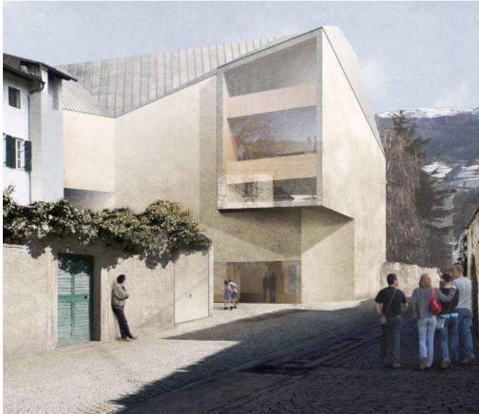
Planungswettbewerb Stadtbibliothek Brixen – das Ergebnis Concorso di progettazione Biblioteca civica di Bressanone, l'esito