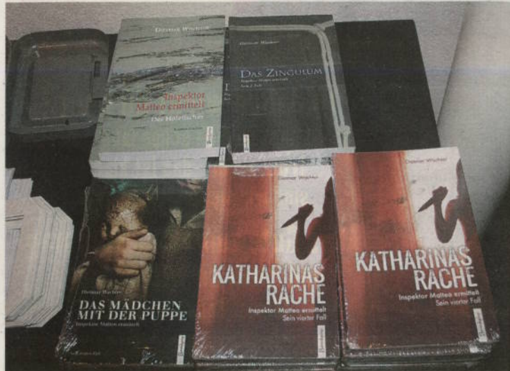
Die vier Krimis sind jeweils um 12,90 Euro in sämtlichen Buchhandlungen erhältlich.

ausgerechnet Steiningers Kater „Rigoletto“ in eine Tierfalle?